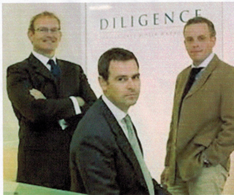
Основатели частной разведывательной компании Diligence