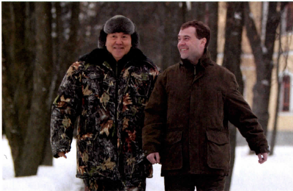
Grand frère. Noursoultan Nazarbaev avec son homologue russe, le président Dmitri Medvedev (à dr.), en 2010.