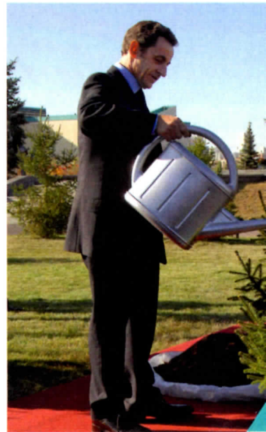
VRP. Le président Sarkozy à Astana, le 6 octobre

■ ■ ■ pelisse et coiffé d'une chapka, un accoutrement devenu la risée des réseaux sociaux. « On a senti le coup venir parce qu'ils nous ont demandé son tour de tête », admet-on à l'Élysée.