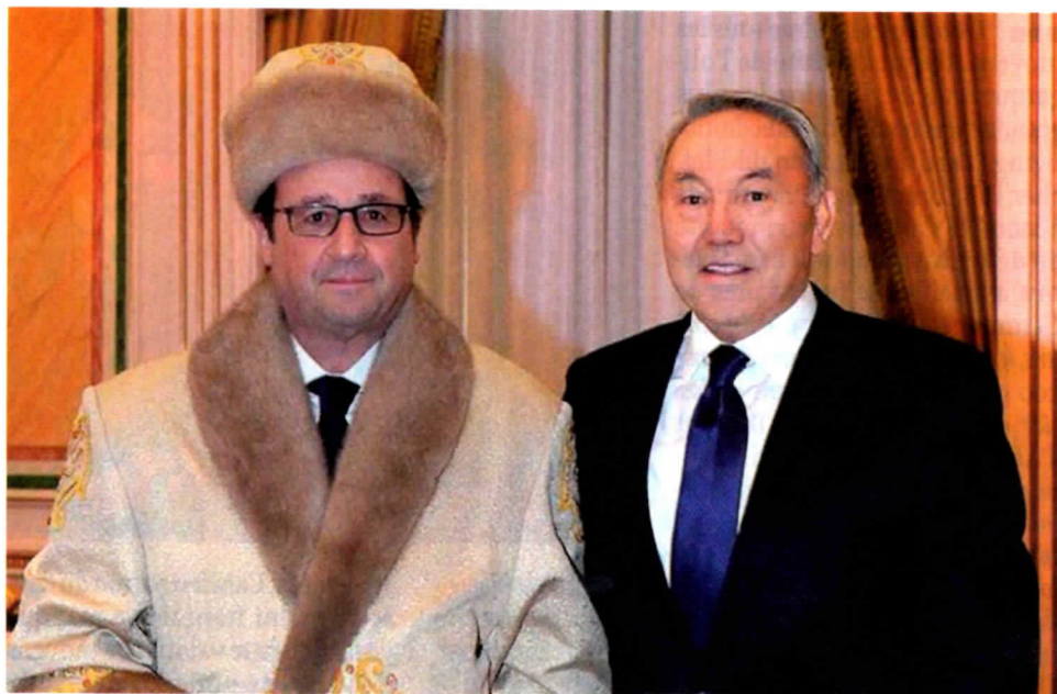
Tweets. François Hollande avec Noursoultan Nazarbaev à Astana, le 5 décembre. La tenue présidentielle a fait le buzz...