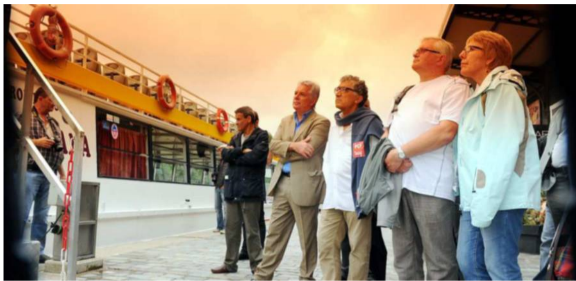
Paris (XIX e), hier. Pas de trêve estivale pour les militants communistes qui, après avoir tracté pour la Fête de l'Huma, s'offrent tout de même une balade en péniche.