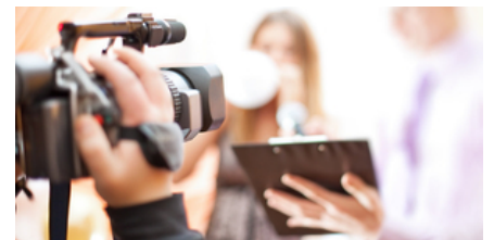
Les reportages vidéo du "Matin"

Le texte avait été rédigé en grande partie et corrigé des questions gênantes, comme la mention aux droits de l'Homme, par un lobby kazakh. A la manœuvre figurait l'agence de relations publiques Burson-Marsteller, a révélé mercredi 6 mai la Neue Zürcher Zeitung .